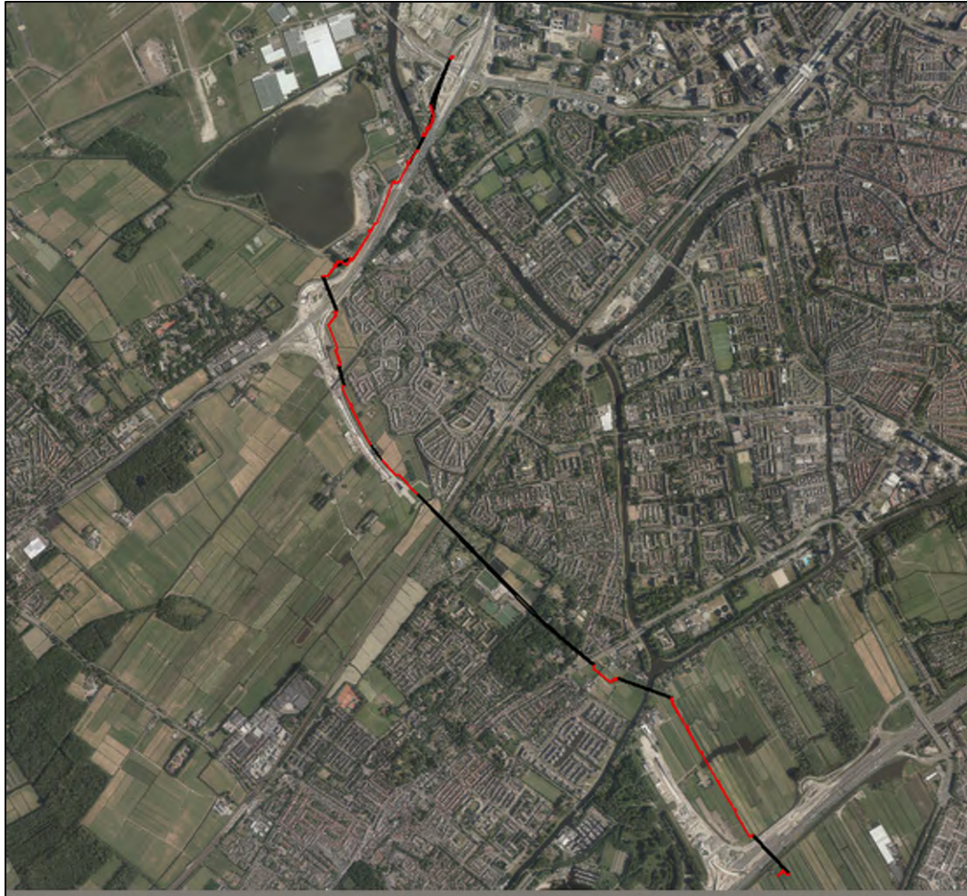
Figuur 1.1. Ligging van lot F van het WarmtelinQ-tracé te Leiden.

aanwezige bebouwing, bosschages en enkele braakliggende percelen. Ook wordt hier gewerkt aan de aansluiting van de Rijnlandroute met de Rijksweg A44. Ten noordwesten van het tracé bevindt zich hier een grote zandwinningsplas. Met twee HDD-boringen worden onder andere de Oude Rijn en de provinciale weg N206 gekruist. Het tracé eindigt ten noorden van het kruispunt tussen de Plesmanlaan en de Ir. G. Tjalmaweg.